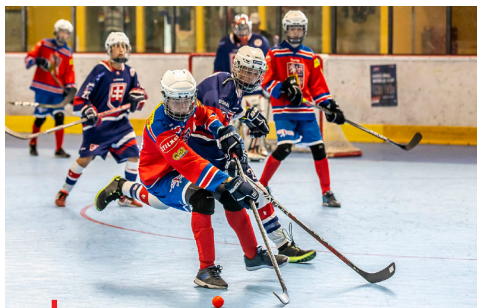
Sport chce od státu stejně prostředků jako kultura - třináct miliard korun

Stejně jako kultura, tedy třináct miliard. To je zcela legitimní požadavek. Je to dokonce v Konceptci podpory sportu do roku 2025, kterou schválila vláda. Vlády v minulosti schválily několik skvělých koncepcí, ale nikdo už o nich nic neví. Doufáme, že Andrej Babiš, který slíbil velké investice do sportu a reálně mu skutečně pomáhá, s tou zoufalou situací něco udělá. Činit se teď ale musí zejména ministr školství.