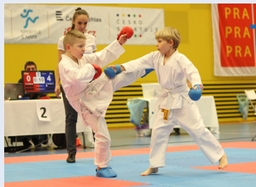
Na čtvrtém ročníku Kamizawa Cupu v Praze se představilo 250 mladých vyznavačů karate.

V průběhu turnaje se bojovníci podle věku a úrovně postupně představili v kategoriích techniky, kata a kumite, dále se sváděly souboje v chytání pásu, jehož cílem je chytit a odebrat protivníkovi jeho pásek. Nejoblíbenější soutěží - hlavně mezi nejmladšími účastníky - bylo karate agility, kde se účastníci v co nejkratším čase snažili zdolat trať plnou překážek a různých nástrah.